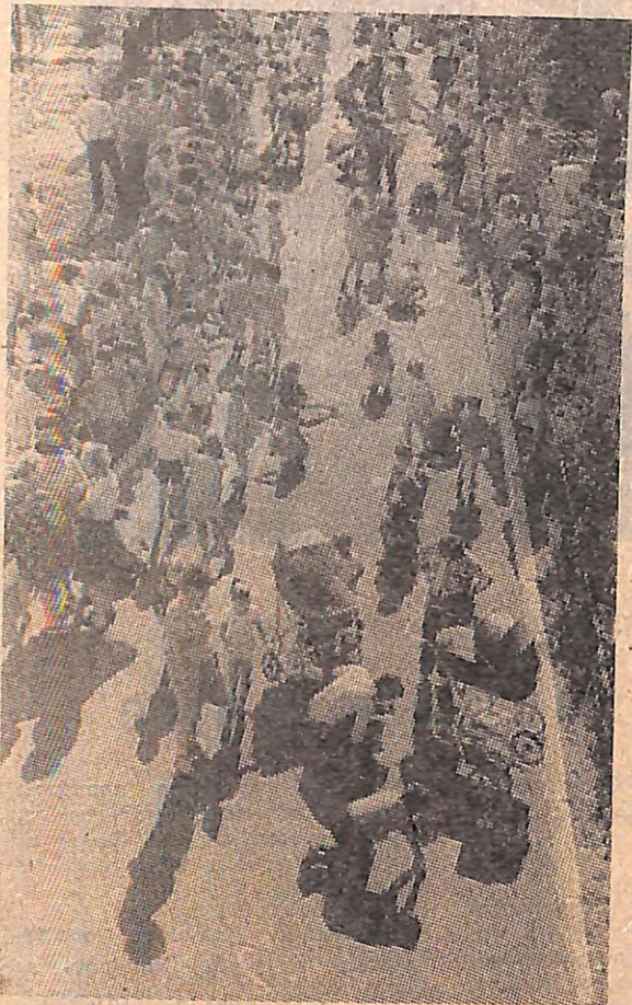
На снимке: конкурс детского рисунка на асфальте.

Именно таким словом можно охарактеризовать и мирную внешнюю политику нашего государства. 6 августа 1985 года вступил в действие односторонний советский мораторий на все ядерные взрывы. Нынешний год ознаменовался исторической инициативой СССР: полностью ликвидировать ядерное оружие до 2000 года. «Сегодня, — сказал М. С. Горбачев во время своей поездки во Владивосток, — как никогда прежде, важны мобилизация существующего в мире потенциала здравого смысла..., чтобы остановить сползание к катастрофе. Наша решимость сделать для этого все от нас зависящее неизменна».